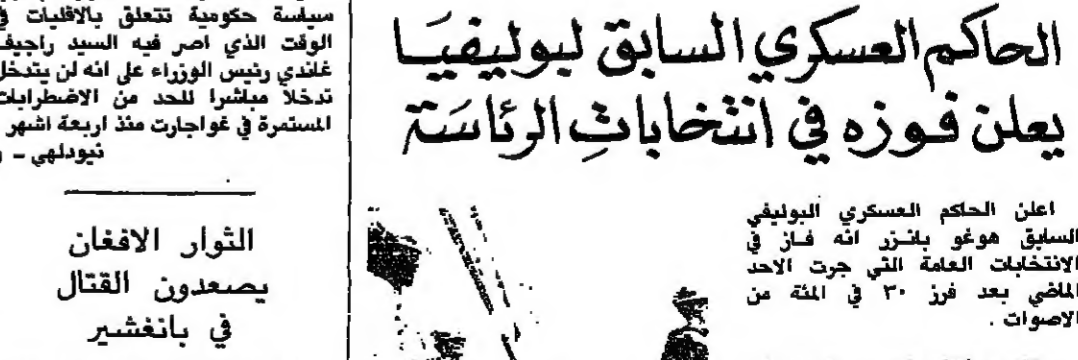
وقال بنزور انه اذا ما اصبح رئيسا ليوليفيا فانه سيعيد للانضمام الى مجموعة فرطالفة التي تضم دول امريكا اللاتينية الدائمة.

اعلن الحاكم العسكري البوليفي السابق هوغو بنزور انه فاز في المضي بعد فرز ٣٠ في المئة من الاصوات.